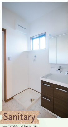
Sanitary 三面鏡が便利な独立洗面化粧台