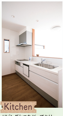
Kitchen リビングとつながっており、家族との会話も弾みます