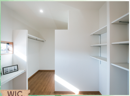
WIC 収納充実が嬉しい!