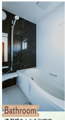
Bathroom 清潔感あふれる浴室で癒しの時間を