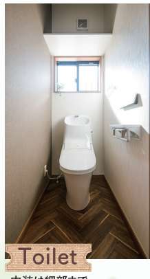
Toilet 内装は細部までこだわっています